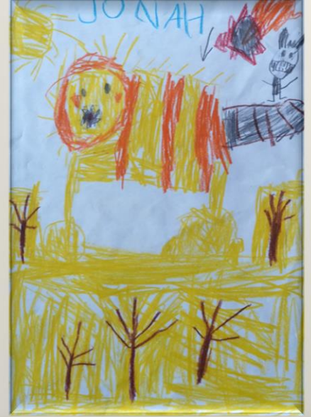
Löwe in Wüste