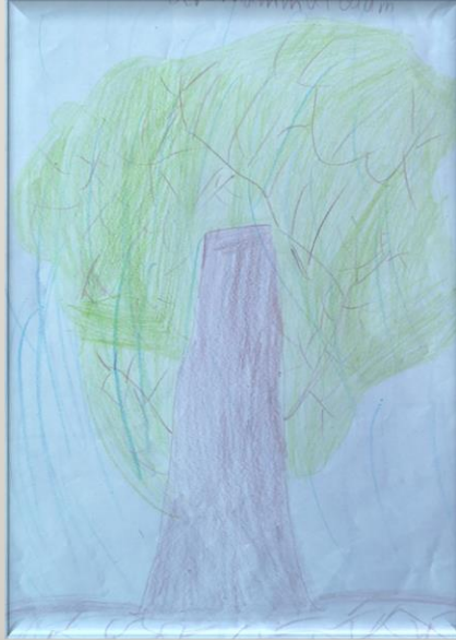
Mammutbaum von Gasteinsendung